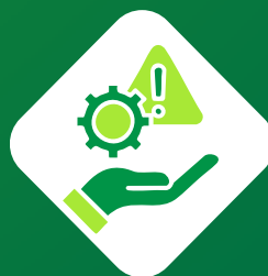
GESTÃO DE RISCOS