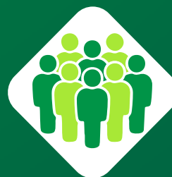
COLABORADORES E DEMAIS DEPARTAMENTOS