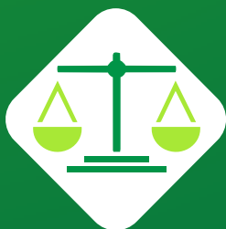
DEPARTAMENTO JURÍDICO E COMPLIANCE