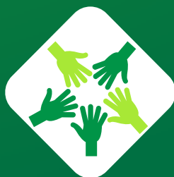
DEPARTAMENTO DE PESSOAS E CULTURA